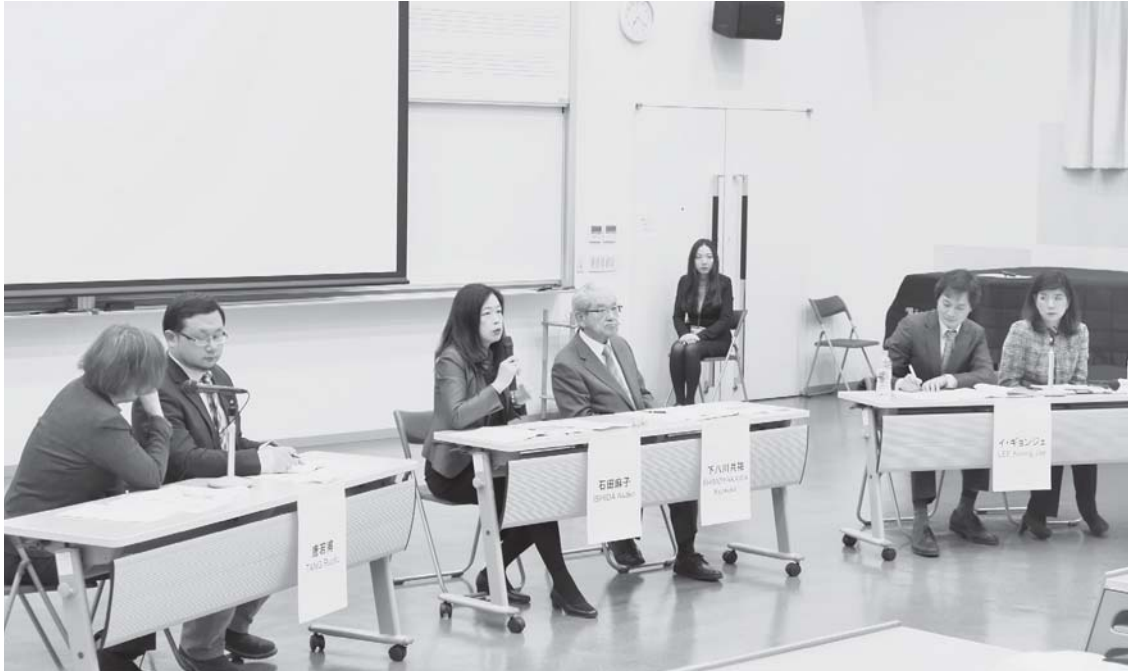
パネル・ディスカッションの様子