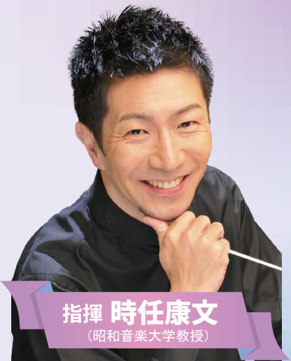
指揮 時任 康文