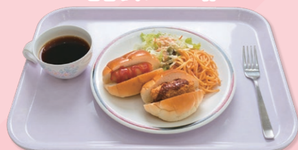
ロールパンセット (朝食)