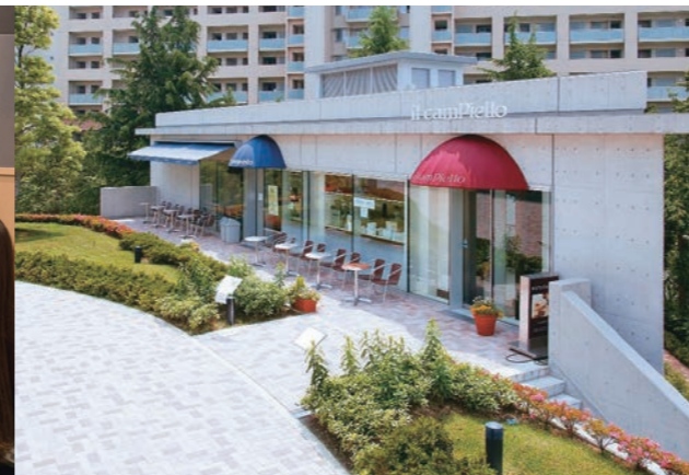
カフェカンビエロ