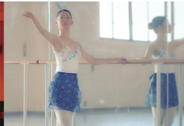
第2スタジオ (北校舎)