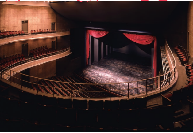
テアトロ・ジューリオ・ショウワ