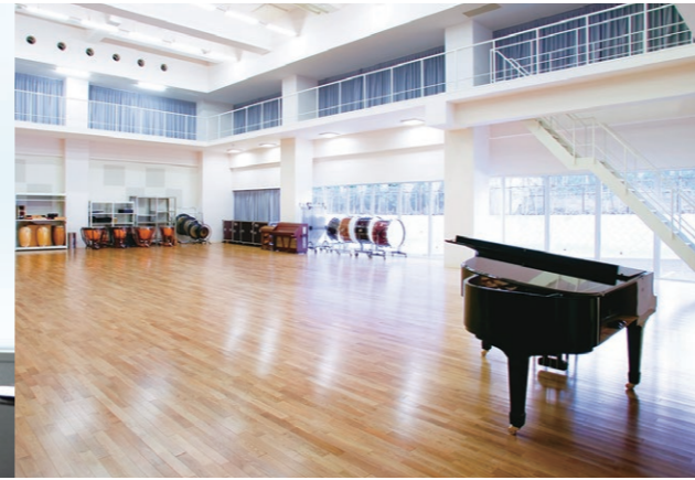
オーケストラスタジオ