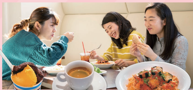
ジェラート (パンブキン/チョコレート)

落ち着いた雰囲気、くつろぎのひとときを過ごせます。 ジェラートやドリンクも好評です。