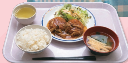
メンチカツ苜おろしソース (昼食)