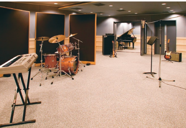
レコーディングスタジオ