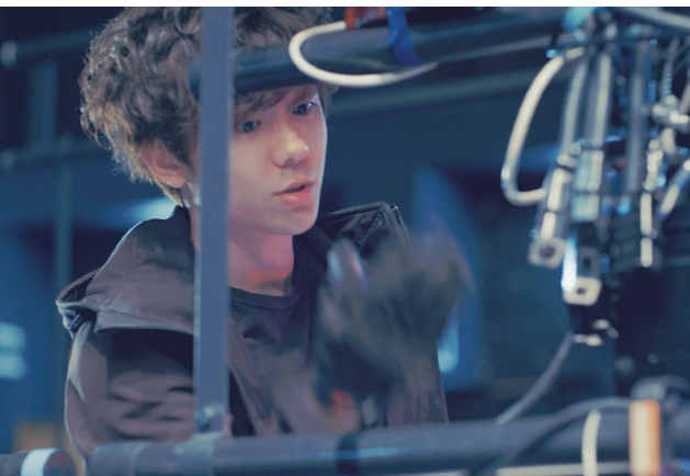
テアトロ・ジューリオ・ショウワ (バックステージ)