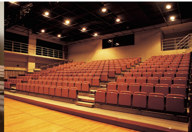
スタジオリリエ (北校舎)