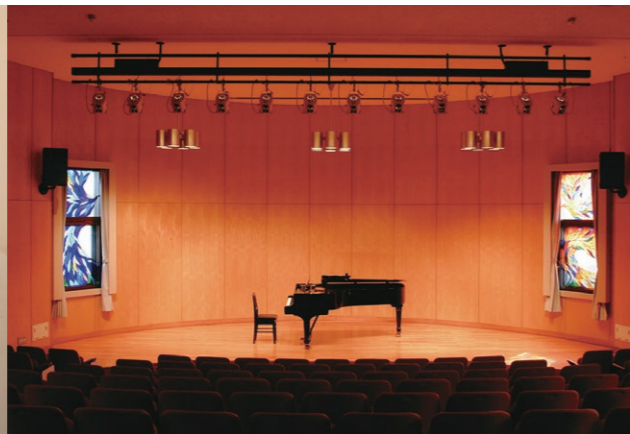
ラ・サーラ・スカラ (北校舎)