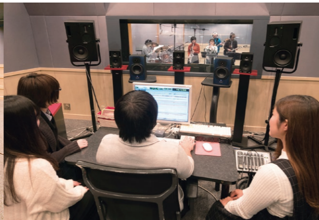
レコーディングスタジオ