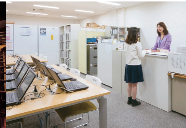
キャリアセンター