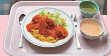
鶏唐揚げピラフ (夕食)