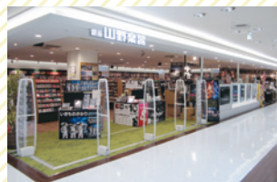
銀座 山野楽器 [楽器、楽譜、CD、音楽教室/南口・徒歩2分 エルミロード4F]