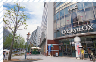
Odakyu OX [スーパーマーケット/北口・徒歩5分]