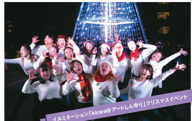
イルミネーション「Kirara@アートしんゆり」クリスマスイベント