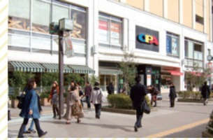
OPA [ファッション/南口・徒歩2分]