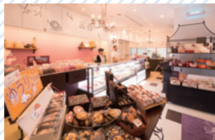
パティスリー・エチエンヌ [スイーツ/北口・徒歩7分]