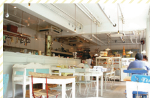
田園ぽと 新百合ヶ丘本店 [スイーツ/南口・徒歩5分]