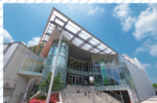
川崎市アートセンター [文化芸術施設/北口・徒歩5分]