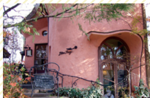
リリエンベルグ [スイーツ/南口・徒歩15分]