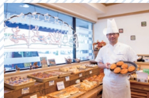
ブルーージェリー・メゾンユキ [パン/北口・徒歩15分]