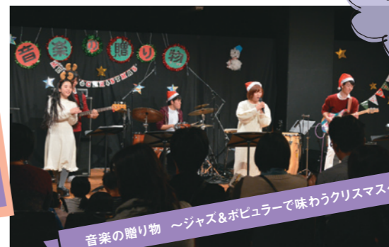
音楽の贈り物 ~ジャズ&ポピュラーで味わうクリスマス~

昭和音楽大学と地域との連携を目指す、独自のプログラムです。近隣の小学校や福祉施設を訪れて演奏や指導を行うなど、音楽を通じた地域活動に、多くの学生が参加しています。