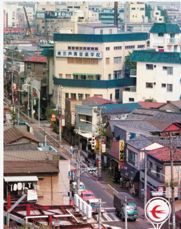
◎建て替え後の校舎と大久保の街並み