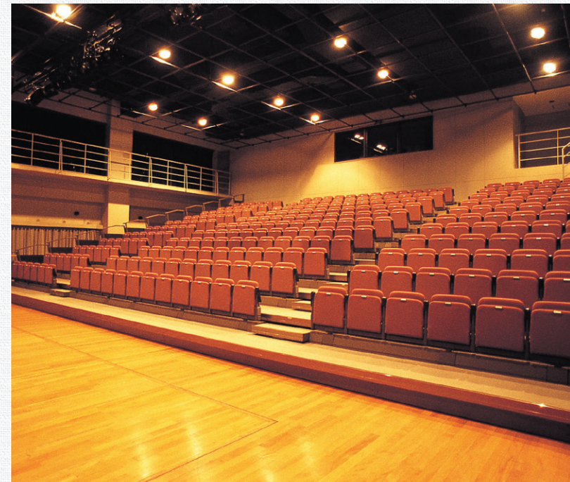
◎5階 第1スタジオ (264席/現・スタジオ・リリエ) 可動式客席のため、ステージ面積を変更できる。 本格的な舞台設備によりミュージカルやバレエの公演が行われている。

◎通りに面した3階ロビー 校舎は傾斜地に建てられているため、裏通りに1階があり、正面入口は2階となっている。