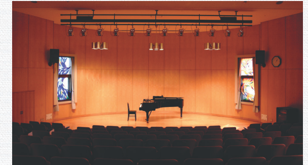
◎5階 ラ・サーラ・スカラ (184席)

◎校舎のフォルムはグランドピアノが象られ、舞台芸術の専門教育を実践するため、多くのスタジオとホールを備える。2007年以降は新百合ヶ丘キャンパスの北校舎として活用されている。