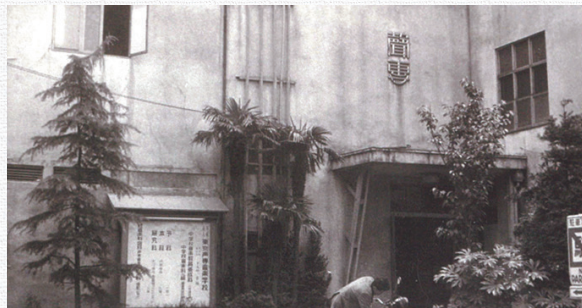
◎戦後に再建した1952年ごろの校舎